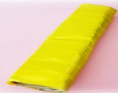
③ビニールテープで包む