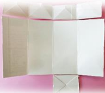
①開け口と底面を切る✂