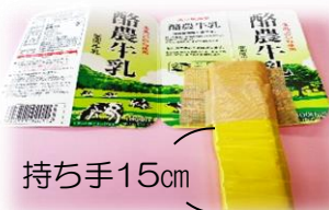
④牛乳パックの裏面に貼り付ける