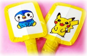
※絵を描いてもかわいいよ♪