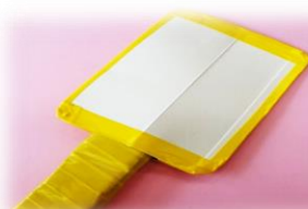
⑤角を丸く切り、ビニールテープで巻いて完成!